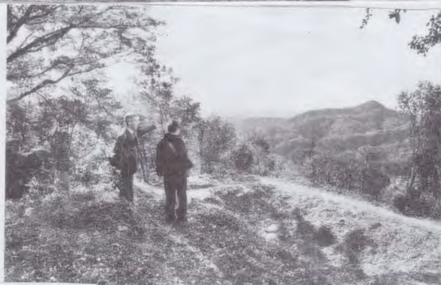
唐沢山城の空堀跡。鍵型に掘られ、敵の侵入を防いだ。栃木県佐野市

唐沢山城 藤原秀郷が942年に築いたという言い伝えもあるが、発掘調査などでその証拠は確認されていない。本丸跡などには、高200mを超える見事な石垣が残る。現在は栃木県立の自然公園として市民に親しまれ、周囲の山々から続くトレッキングコースとして人気を集めている。本丸跡へは、東武佐野線田沼駅から徒歩約40分。