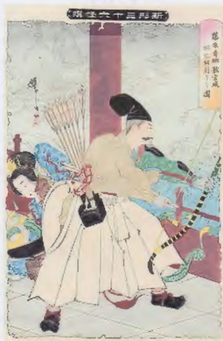
「藤原秀郷龍宮城蜈蚣射の図」 (月岡芳年画『新形三十六怪撰』より)